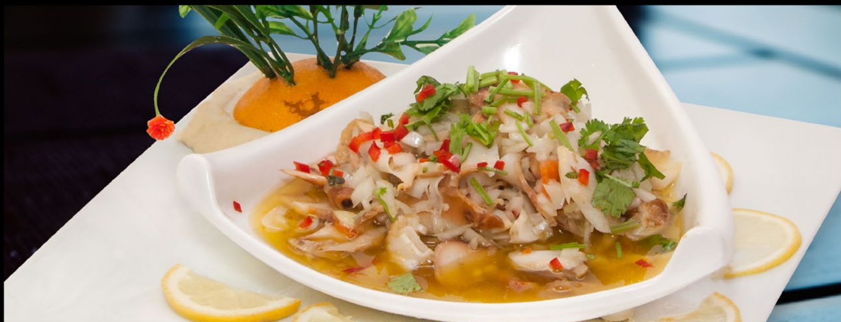
310 凉拌海螺 Salada de Concha | Conch salad 18.00€