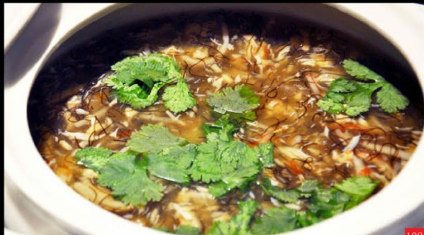
Sopa de pepino do mar | 海参汤 Sea cucumber soup 3.80€