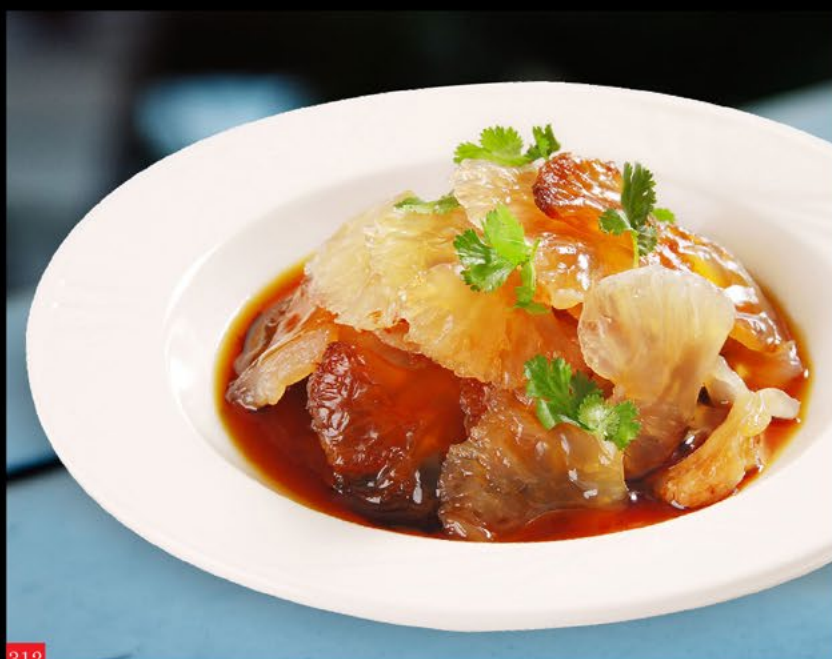
312 凉拌海蜇 Alforreca | Jellyfish salad 10.00€