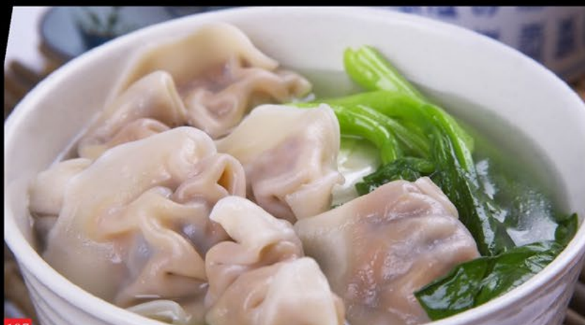
水饺汤 Raviolis de Porco | Dumpling soup 3.50€