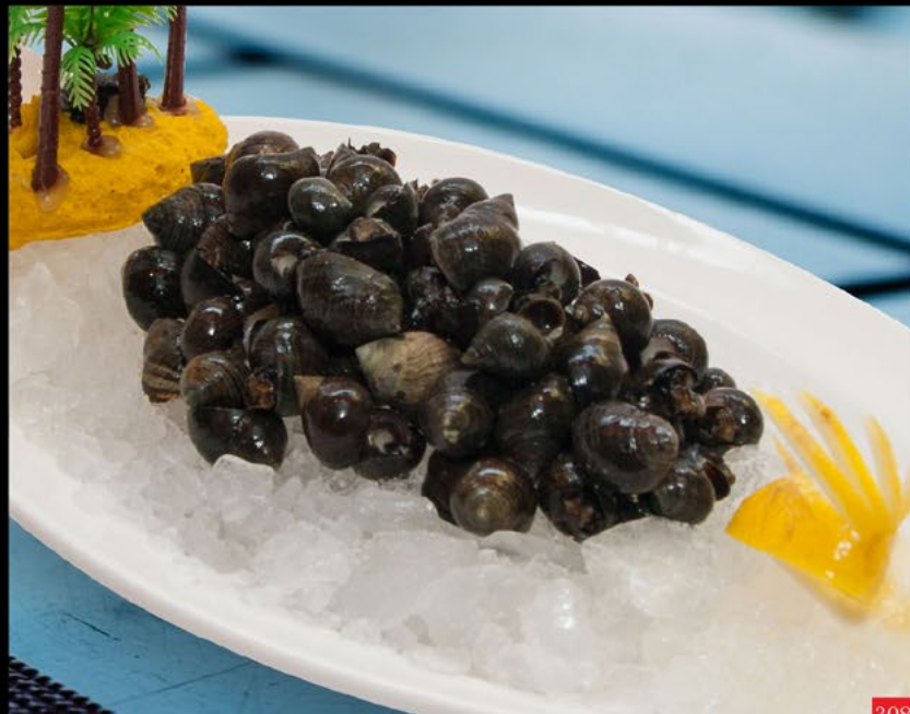
308 螺蛳 Burrié 10.00€