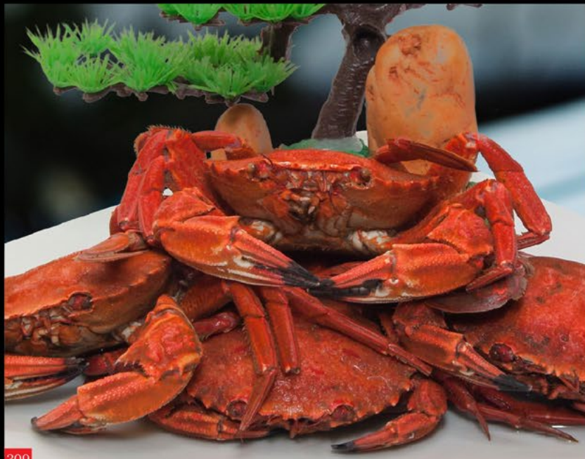
309 河蟹 Navalheira | Crab 20.00€ / 500g.