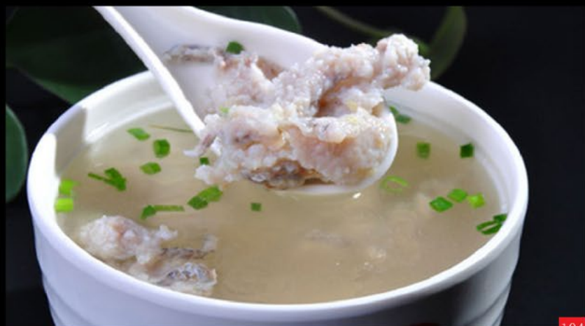
Sopa de peixe | 鱼丸汤 Fish soup 3.50€