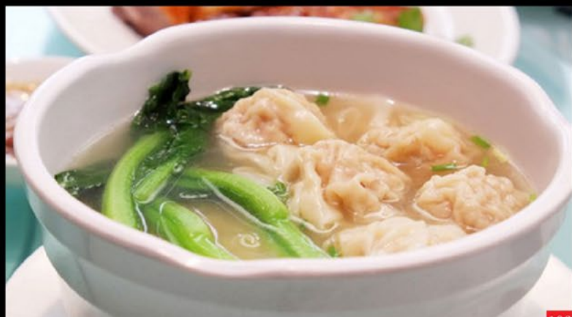
Sopa de van tan | 云吞汤-小 Wontun soup 3.50€ / 8.50€