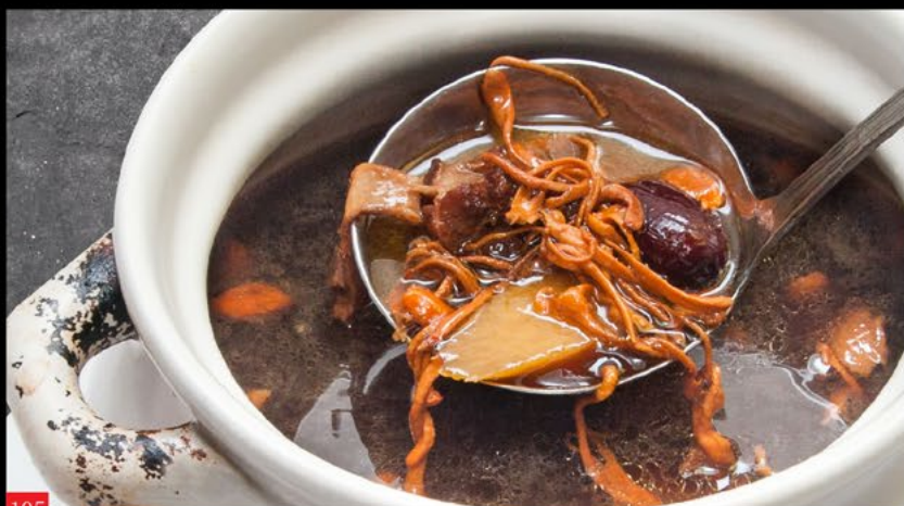
老鸭汤 Sopa de pato | Duck soup 4.50€