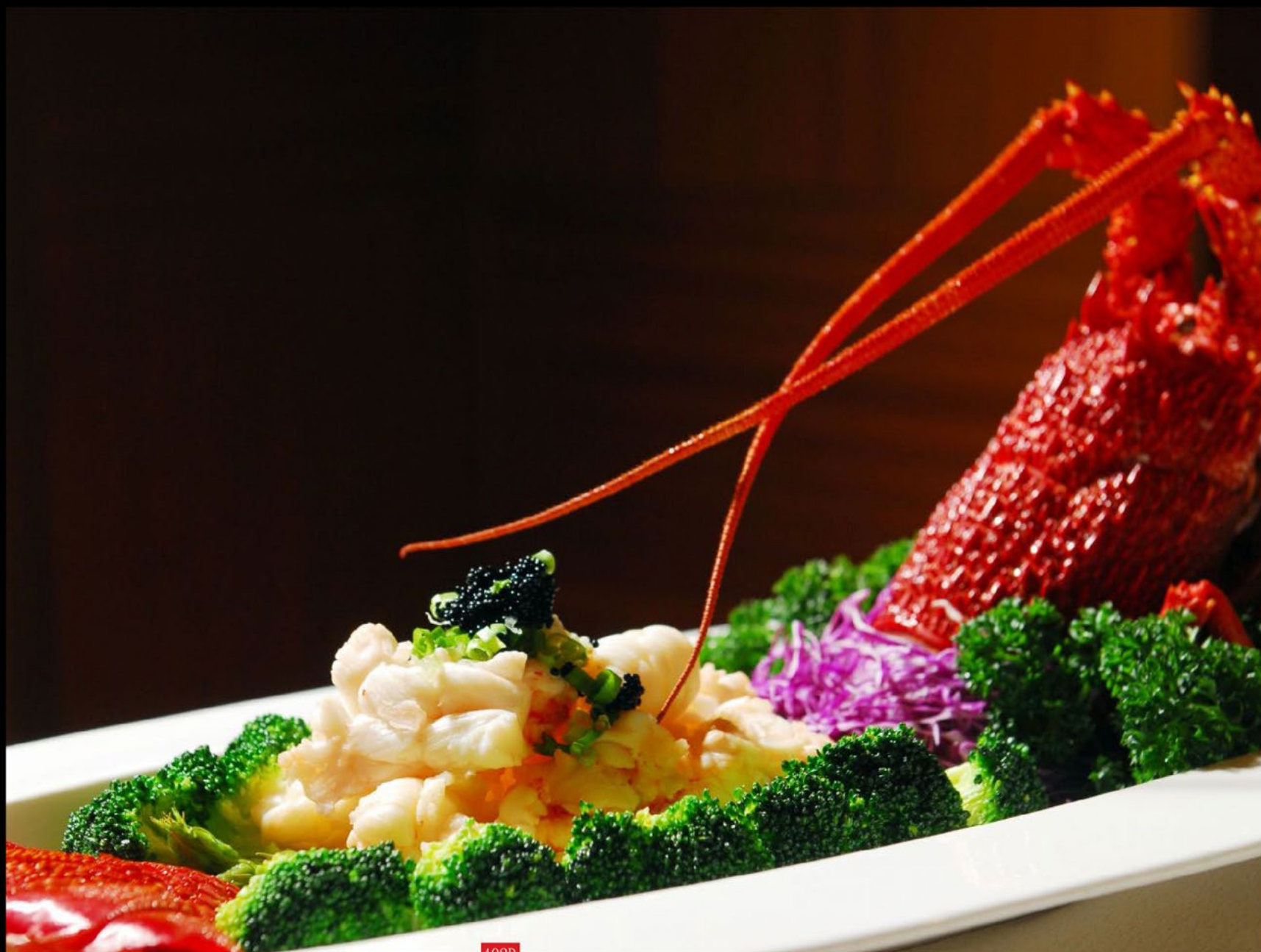
龙虾白灼 Lagosta viva cozida | Steamed live lobster Preço da época | Current price