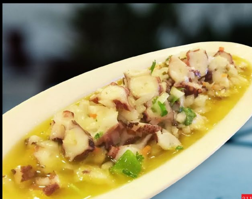
311 章鱼沙拉 Salada de povlo | Octopus salad 8.80€