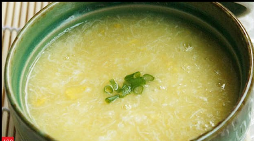
蟹肉羹 Sopa de caranguejo | Crab Soup 3.50€